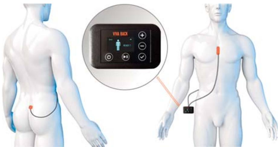
Derzeit noch mit drei, künftig nur noch mit zwei Sensoren misst „Vivaback“, welche dominante Positionen der Rücken im Gehen, Stehen und Sitzen hat

Ob Katzenbuckel oder Besenstiel – Vivaback misst, wie stark man seinen Rücken über den Tag verteilt krümmt und streckt. Das lässt auf Ursachen für Schmerzen schließen.